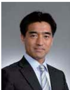
プラチナ社会センター センター長