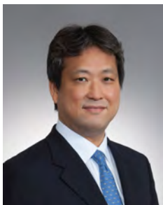
プラチナ社会センター センター長